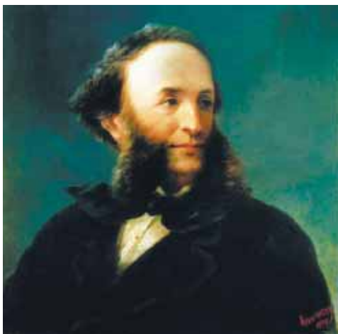
Автопортрет. 1874 год

В Севастопольском художественном музее им. М.П. Крошицкого хранятся бесценные образцы живописи и графики выдающегося мариниста Ивана Константиновича Айвазовского. Мы попросили сотрудников музея рассказать о личности и творчестве нашего знаменитого земляка – уроженца Крыма и певца Черного моря, вся жизнь которого была тесно связана с крымским полуостровом.