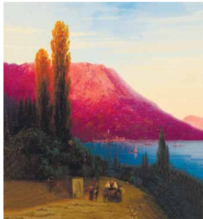
«Крымский вид». 1861 год

Огромной известностью Айвазовский пользовался не только в России, но и во всем мире. Он несколько раз совершал путешествия в Стамбул (Константинополь), где своеобразно соединились черты восточной и западной культур. Первый раз он побывал в этом городе в 1845 году – тогда художник участвовал в средиземноморской географической экспедиции к берегам Турции и Малой Азии под руководством известного русского географа и мореплавателя Федора Литке. По окончании экспедиции маэстро написал большое количество работ, в том числе и «Константинополь при луне» – это полотно хранится в Севастополе.