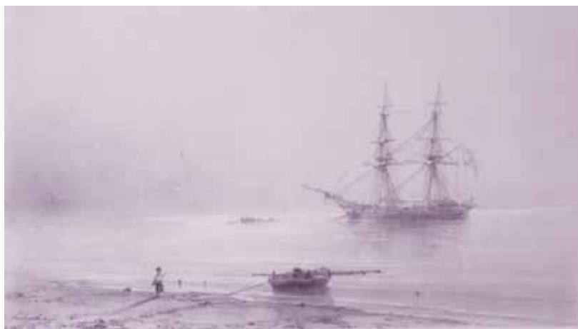
«Морской вид». 1885 год

ные дорожки на водной глади, и тихие вечера, и повседневную жизнь на море.