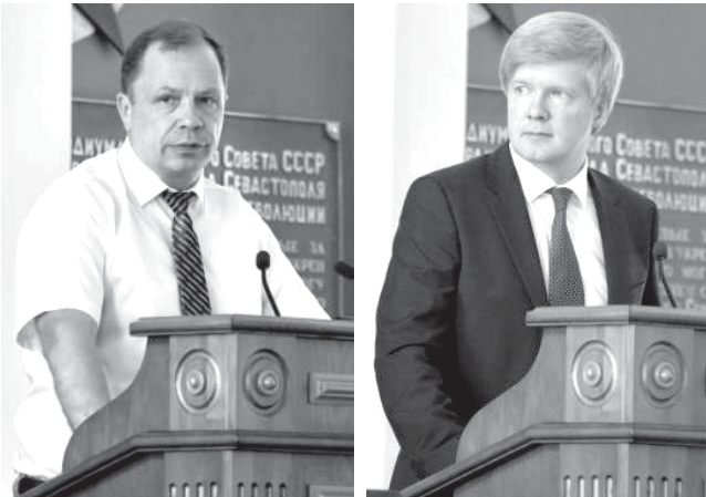
(Продолжение. Начало на 1-й стр.)