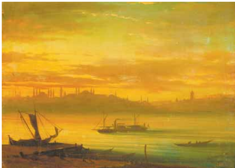
«Вид Босфора». 1864 год