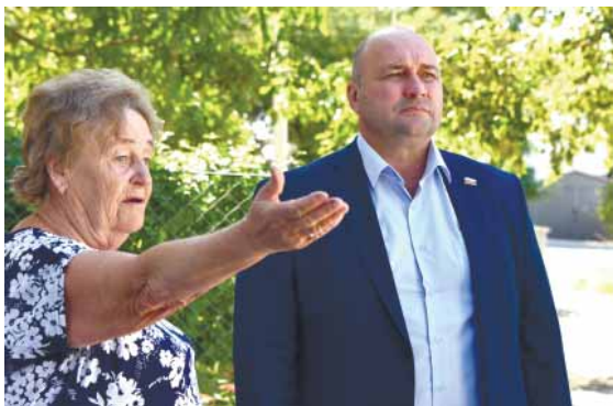
улице Хрусталева. Она также пожаловалась на нерегулярный вывоз мусора и покос травы.